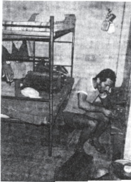
Los internos quieren rehabilitarse pero carecen de talleres.

La calamitosa situación en que viven los internos fue observada por el intendente de Policía de Pichincha en su visita al Centro de Detención Provisional, COP. "En dos pequeñas cuartuchos hay no me nos de cien personas. Los más antiguos permanecen sentados, con las piernas recogidas porque ya no da el espacio y los mas nuevas, deben estar de pie pues los locales no dan cabida para, par lo menos, ponerse en cuclillas acostarse. Los servicios higiénicos están dañados y olores insoportables salen de estos sitios". El hacinamiento agudiza otras condiciones que afectan a los presos. El problema de falta de saneamiento, con corredores llenos de olores de excremento y orinas, la mala alimentación, provocan una proliferación de enfermedades. La falta de atención medica hace que este en riesgo la vida misma de los presos.