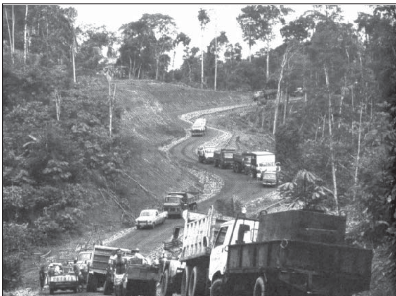
La Vía Aucas se interna en territorio waorani-tagaeri. Imagen publicada en: "El exterminio de los pueblos ocultos" de Miguel Ángel Cabodevilla. Ed. Cicam 2009.

Una importante corriente de opinión sostiene en el país que se está dando mucha más importancia al cambio climático que a las agresiones a los territorios indígenas