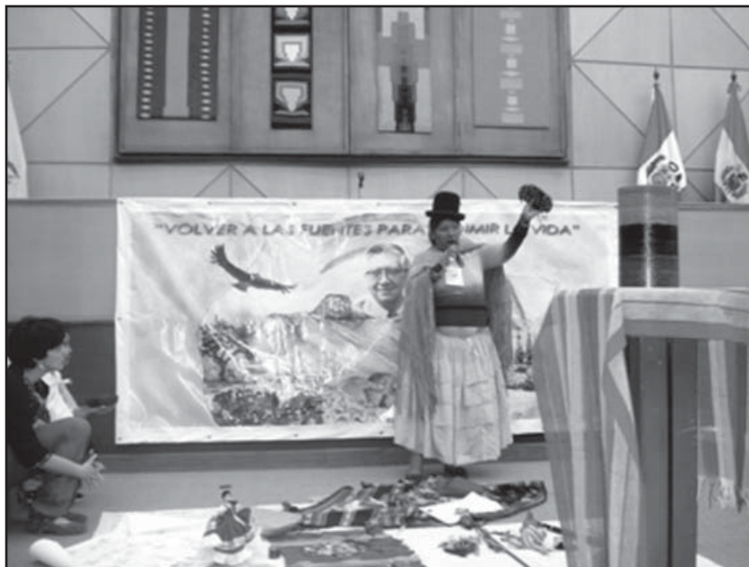
Encuentro Latinoamericano en Homenaje al I Centenario del Nacimiento de Monseñor Leonidas Proaño

Aunque muchas constituciones reconocen los derechos de la Pachamama, en Ecuador el derecho a gozar de un ambiente equilibrado sigue siendo un tema polémico que se discute también en otros países de América Latina y el mundo. Desde esta perspectiva las zonas y territorios indígenas sufren una