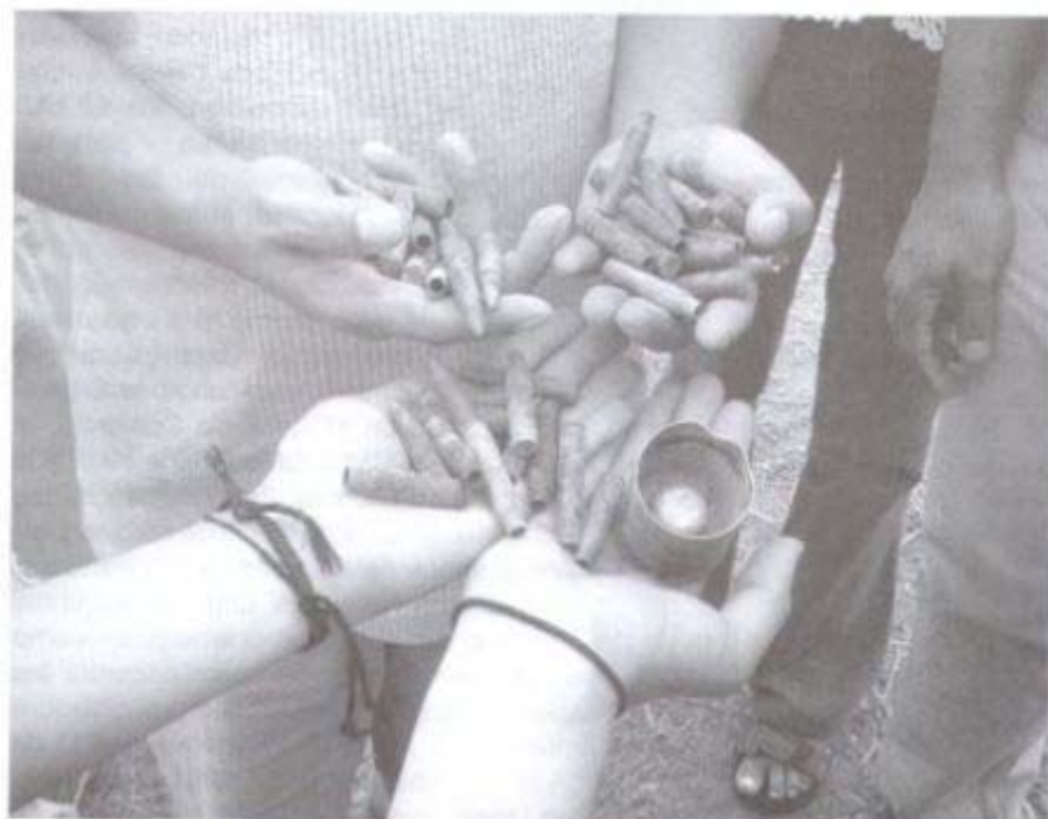
Casquillos encontrados en sectores poblados junto al Polígono de Tiro en la Base de Manta.

Agradecemos al entrevistado y a AFSC/CAS.