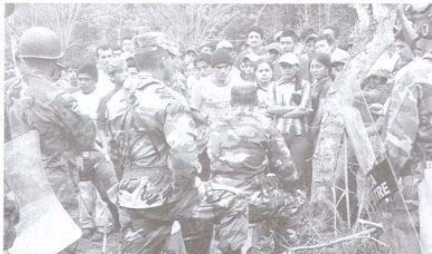
Presencia militar en el Proyecto Hidrotambo