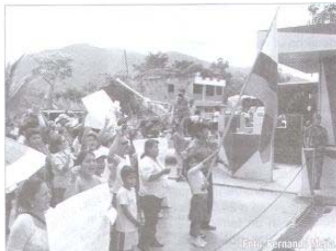
Marcha contra Ecuacorriente